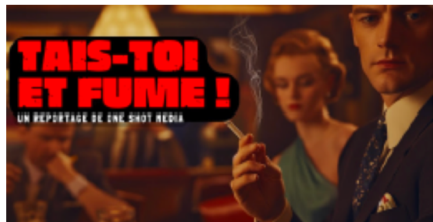
« Tais-toi et Fume ! » Episode 1