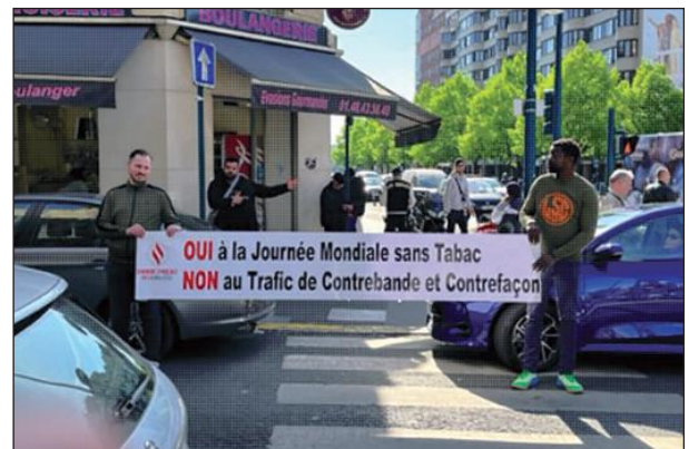
📍 Pantin (93)

Parce que ces points de deals existent partout en Île-de-France. De Paris à Aubervilliers, en passant par Bondy ou par Juvisy, les revendeurs sont là. Nous avons donc décidé d'y être aussi, le temps d'une photo parce que les mots ne suffisent plus. Il faut que cette réalité quotidienne soit montrée, affichée et dénoncée.