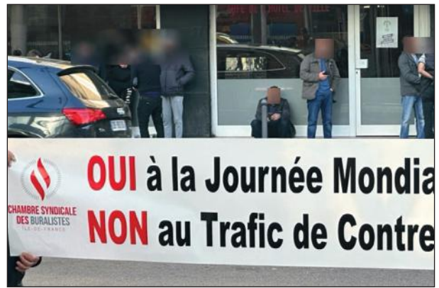
📍 Villeneuve-Saint-Georges (94)