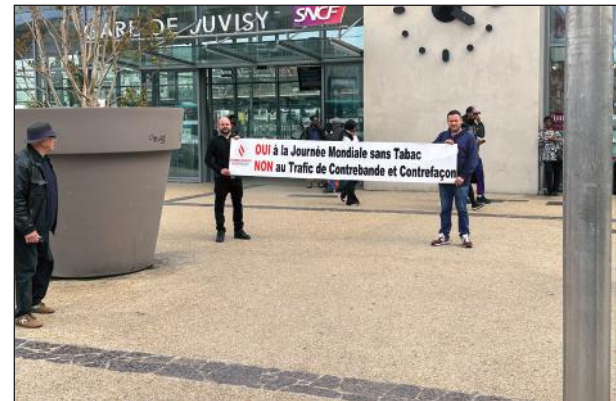
Gare de Juvisy (91)