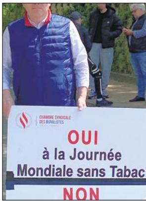
📍 Melun (77)