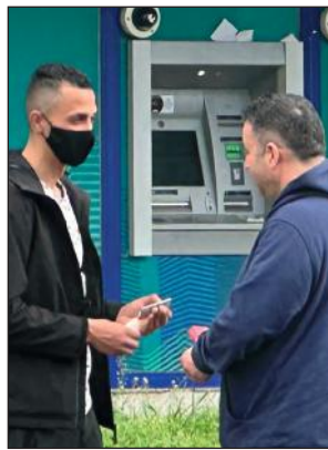
📍 Massy (91)