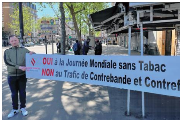
📍 Montreuil (93)